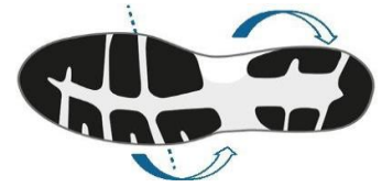
Figur 5. Sulan ska vara vridstyv.