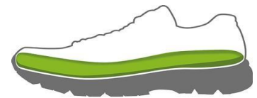
Figur 2. Skon bör ha löstagbar innersula.

För bra funktion och komfort rekommenderas en promenadsko (en så kallad "walkingsko") som ger dina fötter bästa stöd och gångkomfort (Figur 3).