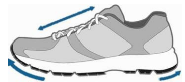
Figur 3. En så kallad "walkingsko" är rundad vid tårna och vid hälen

För att ge en bra stabilitet i fot och ankel ska skon ha en stabil hälkappa (Figur 4).