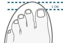
Figur 1. Skon ska vara ungefär 10 mm längre än din längsta tå

Skon bör ha en löstagbar innersula för att vid behov kunna ersätta den med en annan innersula (Figur 2).