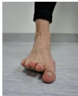
Figur 6 visar andra delen av övning 3