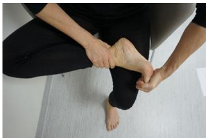
Figur 1 visar första delen av övning 4

Ta ut rörligheten i stortå och tår med hjälp av handen. Genom att böja tårna uppåt, bakåt och därefter böja tårna framåt, nedåt.