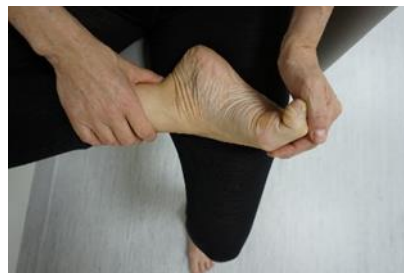
Figur 8 visar andra delen av övning 4

Utför övningarna utspritt under dagen för bästa effekt.