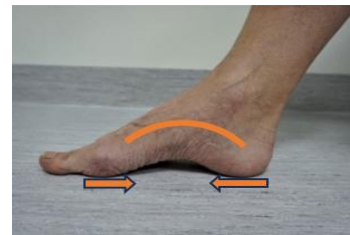
Figur 2 visar övning 1