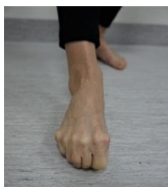
Figur 3 visar första delen av övning 2

Sitt med fötterna i golvet. Slappna av på framsidan av underbenet. Känn att du lyfter upp fotens "knogar" långt bak i foten och tårna. Knip ordentligt med tårna och försök bilda en båge med fotens "knogar", växla och lyft tårna från golvet och spreta dem från varandra. Det är bara tårna som skall lyftas, inte foten. Upprepa 10 gånger åt varje riktning.