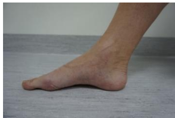
Figur 1 visar utgångspositionen i övning 1

Sitt med fötterna i golvet. Slappna av på framsidan av underbenet. Med raka tår i golvet skall du lyfta fotvalvet och göra foten smalare och kortare och hålfoten "hög". Det skall kännas som du suger upp och lyfter hålfoten långt bak i fotsulan. Tårna skall vara kvar i golvet. Upprepa cirka 10 gånger.