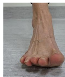
Figur 4 visar andra delen av övning 2