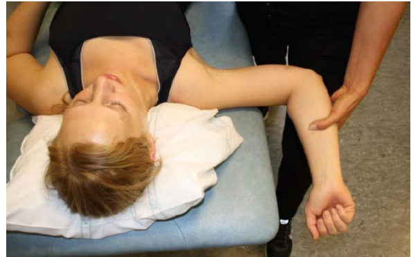
Bild 1. Apprehension test

Testet är positivt om patienten upplever en obehagskänsla.