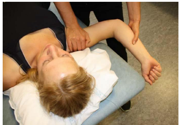
Bild 2. Relocation test

Testet görs genom att patienten ligger på britsen med stöd för halva överarmen. Axelleden är abducerad i 90° och maximalt utåtrotterad. Läggt tryck vid caput och pressa dorsalt. Syftet är att minska trycket på de ventrala stabiliserande strukturerna. Relocation testet är positivt om symtomen minskar.